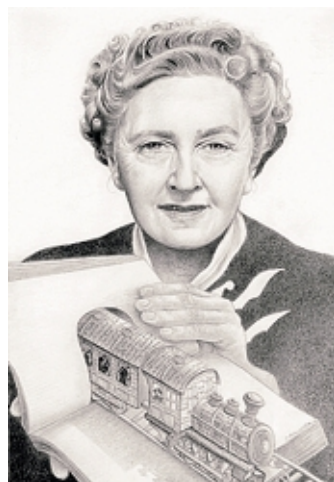
Il ritratto di Agatha Christie

L'iniziativa è compresa nella rassegna "Arte in Atrio" curata da Mario Quadraroli, che ripropone l'opera dell'autrice pavese presentata due anni or sono al Caffè Letterario dove si è fatta conoscere con la medesima tematica, qui ampliata nella ricognizione degli autori, e innervata di inediti effetti. Laureata in storia dell'arte e in scenografia, specializzata in progettazione dell'illustrazione all'Istituto Europeo di Design di Milano e con precedenti presenze espositive, la Tritto trasporta nelle sue tavole suggerimenti at-